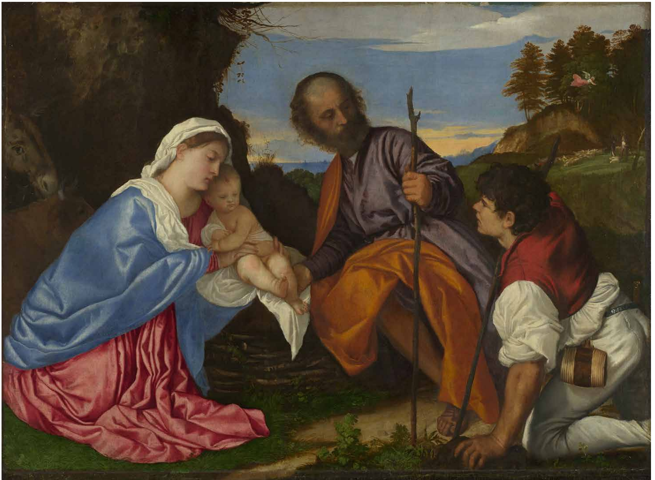
Tiziano Vecellio, Sacra Famiglia con un pastore (1510) - (Londra)